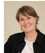
Angelika Moosbrugger Bürgermeisterin Wolfurt