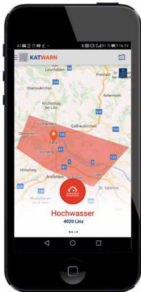
Beispiel einer Hochwasserwarnung.

Jeder Einrichtung oder Behörde, die KATWARN Österreich/Austria nutzt, steht ein entwickeltes und speziell gesichertes Redaktionssystem zur Verfügung. Hiermit können im Ernstfall einfach, sicher und schnell die betroffenen Empfängergruppen (z. B. nach Postleitzahlen) ausgewählt, Warntexte verfasst und Warnungen versendet bzw. Entwarnungen ausgesendet werden. Auf Knopfdruck übermittelt KATWARN Österreich/Austria diese Daten zu den Mobiltelefonen der KATWARN-Nutzer. Das Redaktionssystem ordnet und „verpackt“ diese Daten so, wie sie beim Empfänger in der KATWARN-App angezeigt werden sollen. Dies hilft den betroffenen