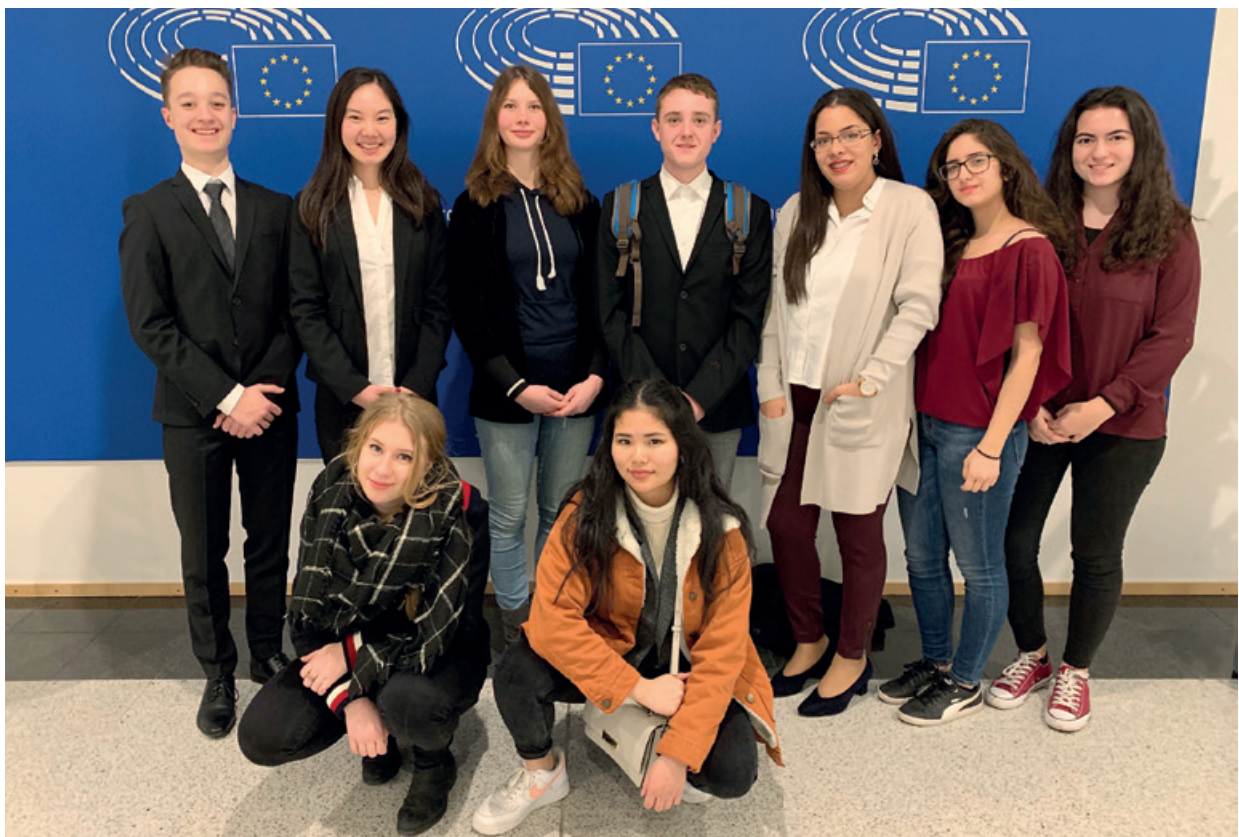
Junge Menschen wollen mehr Mitsprachrecht in der EU haben.

Gemeinsam wünschen wir uns eine Aufwertung der Europabildung in der Öffentlichkeit und umfassende Antworten auf die Fragen der Jugend. Junge Menschen sollen unser Europa als Work-in-progress