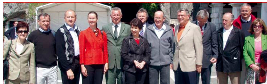
Laibach – Zusammentreffen der Delegation mit NR-Präs. Barbara Prammer und dem slowenischen Parlamentspräsidenten France Cukjati.

Im Berichtszeitraum besuchten ca. 100 Vertreterinnen und Vertreter aus der kommunalen Praxis die Außenstelle des Österreichischen Gemeindebundes in Brüssel. Großteils handelte es sich dabei