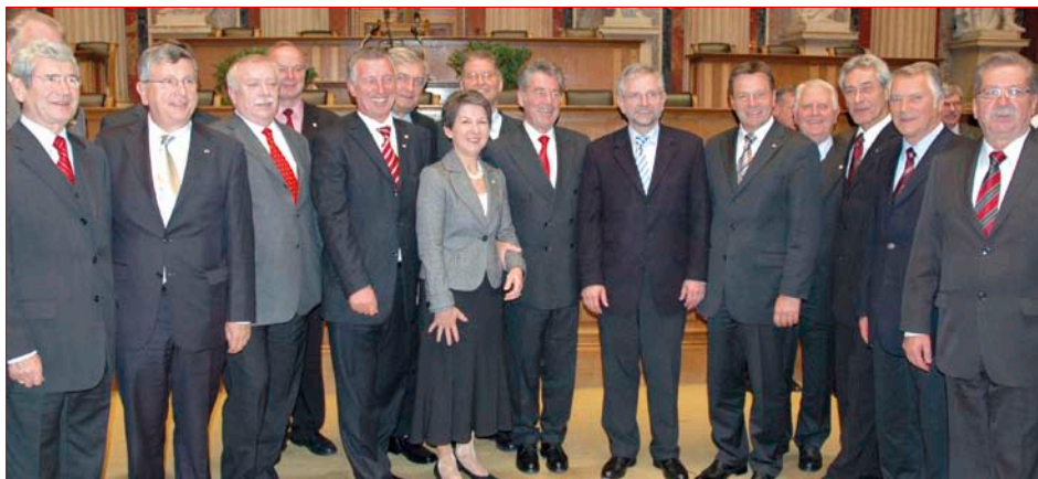
Festakt anlässlich 60 Jahre Österreichischer Gemeindebund im Parlament

Zum insgesamt dritten Mal haben die Kommunalen Sommergespräche des Österreichischen Gemeindebundes, in Zusammenarbeit mit seinem Partner, der Kommunalkredit Austria, stattgefunden. Von 30. Juli bis 1. August 2008 kamen zahlreiche erfahrene Politiker und Experten aus Wirtschaft und Wissenschaft in Bad Aussee, dem geographischen Mittelpunkt Österreichs, zusammen. Mittlerweile sind die kommunalen Sommergespräche ein für die Kommunalpolitik traditioneller Veranstaltungstyp,