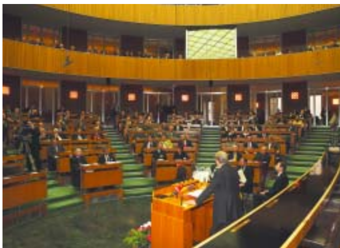
Klestil würdigte die Grundfeste des Staates

15 Jahre Verankerung des Österreichischen Gemeindebundes und des Österreichischen Städtebundes in der Bundesverfassung nahmen die Interessensvertretungen zum Anlass, am 14. November 2003 einen Festakt zu begehen.