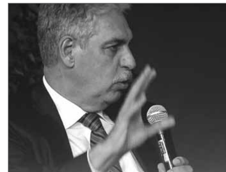
BM Schelling bei der Fachtagung des 62. Gemeindetages in Wien

Zum Finanzausgleich hielt Präsident Mödlhammer fest, dass die Gemeinden die einzige Gebietskörperschaft in diesem Land sind, die bis auf die Krisenjahre 2009 und 2010 den Stabilitätspakt eingehalten, ja sogar übererfüllt haben. So könne man selbstbewusst in diese Gespräche gehen. Ziel müsse ein fairer, ein gerechter Finanzausgleich sein, „der den Menschen