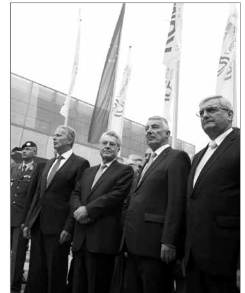
Prominenter Besuch beim 62. Gemeindetag in Wien

in allen Regionen, in den kleinen Dörfern ebenso wie in den Ballungszentren, die gleichen Chancen und gleichwertige Lebensbedingungen ermöglicht“. Die daraus abgeleiteten Grundforderungen ergeben sich logisch: Der längst nicht mehr zeitgemäße abgestufte Bevölkerungsschlüssel müsse abgeschafft oder zumindest weiter abgeflacht werden, und es sei ein ausreichend dotierter Sondertopf für Infrastrukturmaßnahmen in benachteiligten Regionen einzurichten. Den vielen Versprechungen und Bekenntnissen zur Erhaltung des ländlichen Raumes müssten endlich Taten folgen.