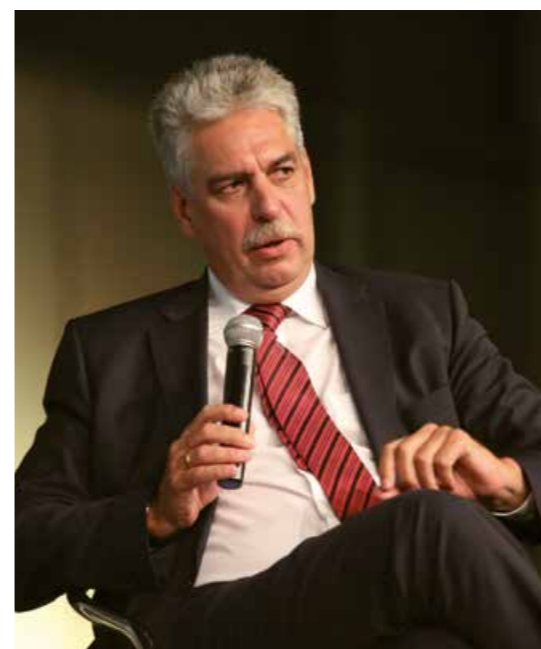
Unmittelbar nach der Regierungsklausur war Hans Jörg Schelling ins Auto gestiegen und zur Fachtagung gekommen. – und bewies damit einen Mut, den etliche Regierungsmitglieder nicht aufgebracht hatten.