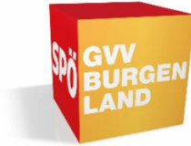
Bgm. Erich Trummer (Präsident des GVV Burgenland)