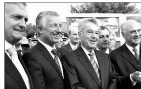
Am Gemeindetag 2012

Auch die Zusammenlegungsdebatte bei Gemeinden fand Erwähnung. Weiterhin sei die Leitlinie des Gemeindebundes, dass die Menschen bei solchen Vorhaben eingebunden sein müssen und mitentscheiden können. Von Zwangszusammenlegungen, deren wirtschaftlicher Nutzen nicht bewiesen ist, sei nichts zu halten. Durch Zusammenlegungen spare man keine einzige Kindergärtnerin, keinen Straßenmitarbeiter, keinen Pflegehelfer oder