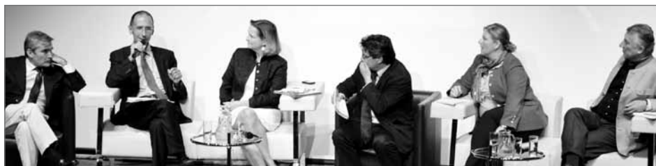
Angeregte Diskutanten bei den Kommunalen Sommergesprächen