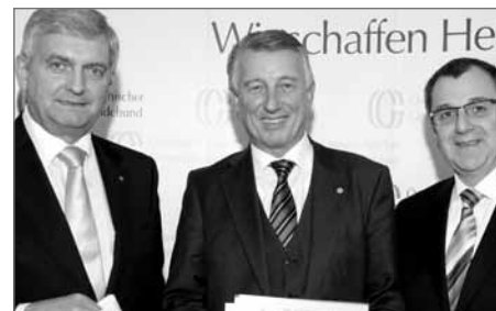
Gemeindebundpräsidium einstimmig im Amt bestätigt: Präsident Mödlhammer mit seinen beiden „Vize“ Riedl und Dworak

Im Rahmen der Bundesvorstandssitzung am 28. Februar 2012 wurde Präsident Helmut Mödlhammer und seine beiden Vizepräsidenten Bgm. Mag. Alfred Riedl und Bgm. Rupert Dworak für eine weitere Periode in ihrem Amt einstimmig bestätigt. Mödlhammer steht seit 1999 an der Spitze des Österreichischen Gemeindebundes. Präsident Mödlhammer dankte für das ent-